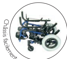
Chassis facilement pliable