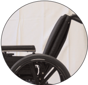
Dossier à angle réglable

Dossier en angle réglable de -5 degrés à 25 degrés.