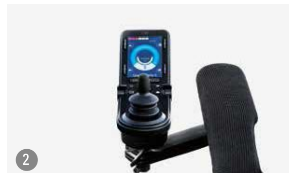
2 - Manipulateur R-Net Advanced